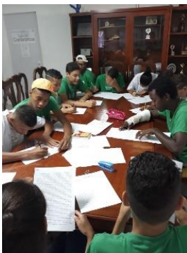
Discussão da XI Conferência Nacional dos Direitos da Criança e do Adolescente – Os adolescentes elaboraram um material e participaram da Conferencia, com tema sugeridos pelo Conselho Municipal da Criança e do adolescente. Atividade e participação de relevante importância para os adolescentes do Município.

Atividades como leitura, compreensão e interpretação de histórias de Monteiro Lobato foram trabalhadas e ao final, realizamos a Feira de Troca de Livros e Contação de histórias para os beneficiários e comunidade.